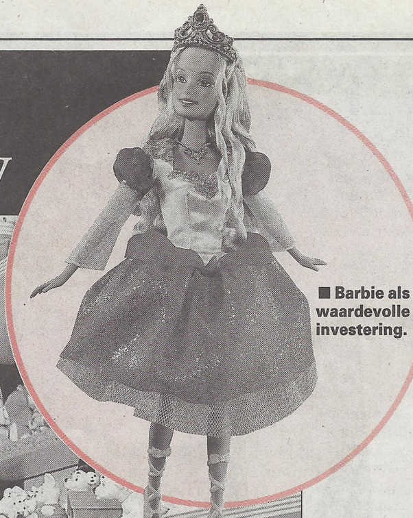
■ Barbie als waardevolle investering.